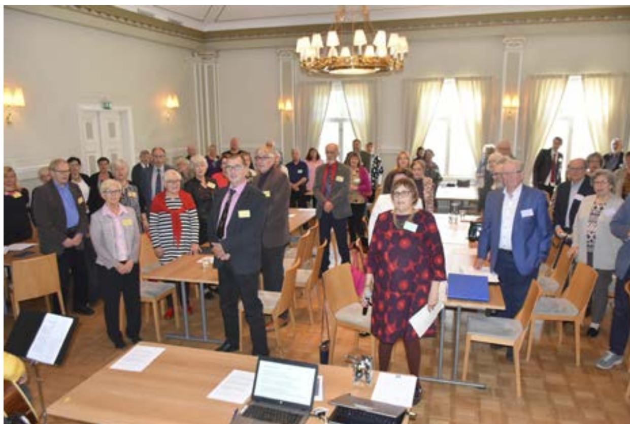
Elersien sukuseuran sukukokous 23.9.2017 Noormarkussa aloitettiin Satakunnan laululla.