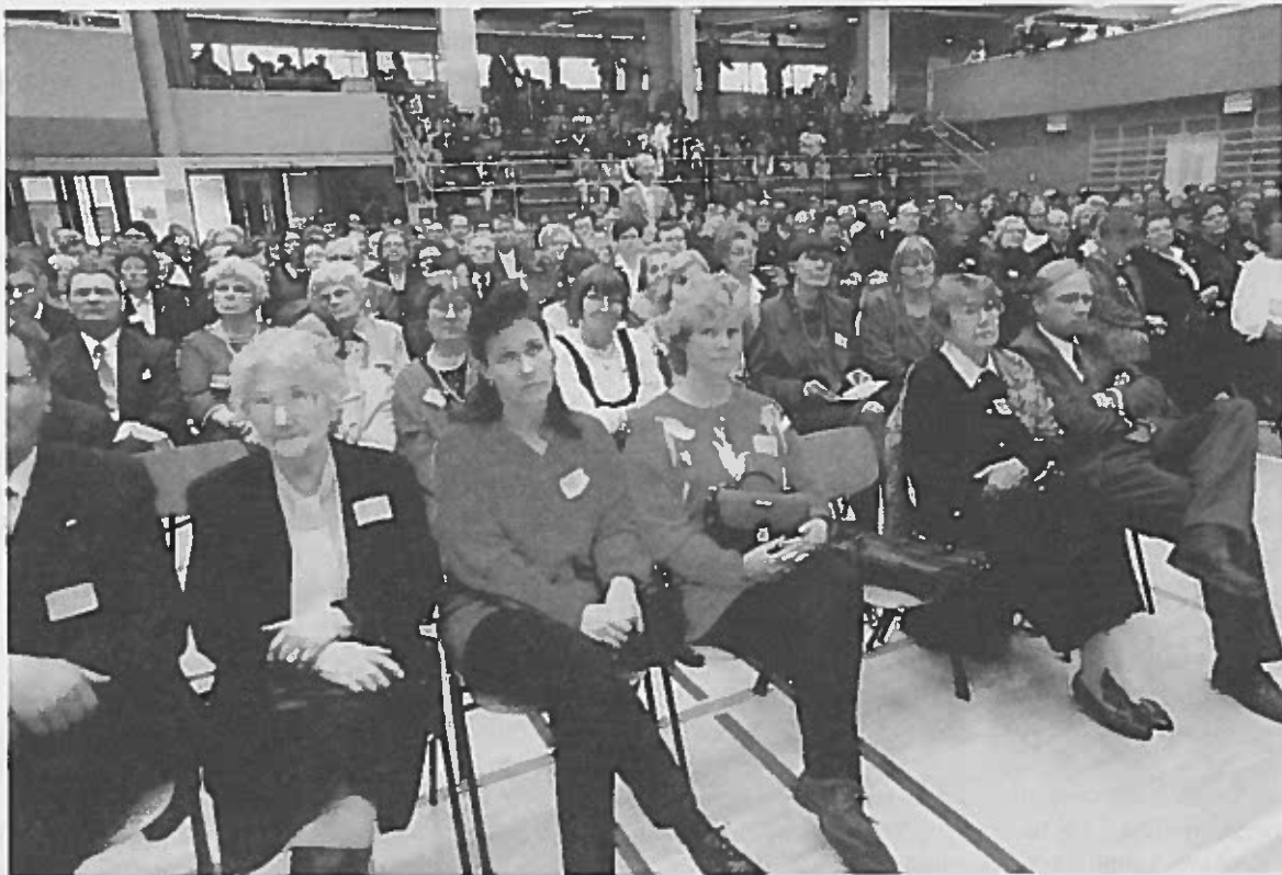
Elersien ensimmäinen sukukokous pidettiin vuoden 1996 lokakuussa Loimaan kunnan keskustajamassa Hirvikoskella sijaitsevassa Hirvihovissa, jonka toivotaan täyttyvän toisessakin sukukokouksessa lokakuussa.

Sukuseuran purkautuessa käytetään seuran varat seuran tarkoituksen edistämiseenpurkamisesta päättävän kokouksen määräämällä tavalla. Sukuseuran tullessa lakkautetuksi käytetään varat samaan tarkoitukseen.