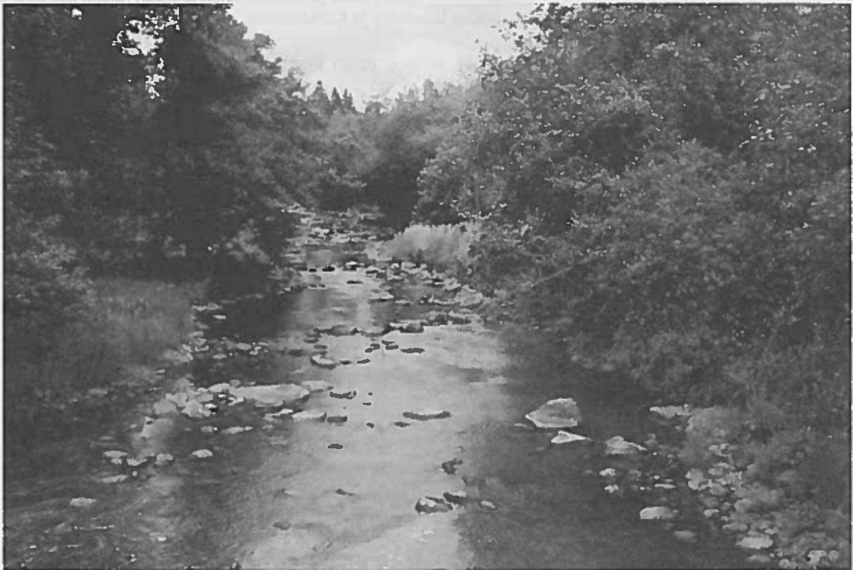
Täältä alkoi Elersien tarina Loimaalla aikoinaan: näillä Koijoen rantakivillä Loimaan kunnan Kojonperästä Iso-Uotilan ja Sullon tilojen tienoilla ovat suvun esivanhemmat astelleet.